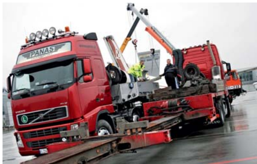
Przed załadunkiem należy przygotować sprzęt do zabezpieczenia ładunku oraz rozciągnąć nacsepę na odpowiednią długość