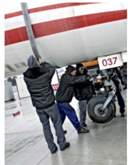
Za załadunek odpowiedzialni byli wojskowi technicy