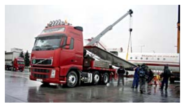
Samolot został opuszczony na nacsepę znajdującą się pod skrzydłami, które zostały odkręcone