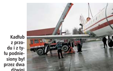
Kadłub z przodu i z tyłu podniesiony był przez dwa dźwigi